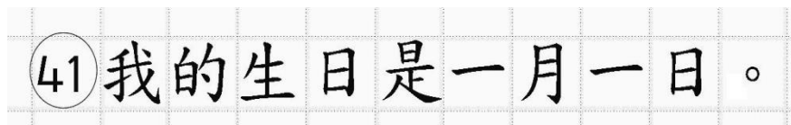
Рис.14. Образец написания иероглифических знаков

иероглифический знак и каждый знак препинания следует писать внутри отдельной клетки области ответов бланка ответов № 2 (дополнительного бланка ответов № 2) (рис. 14).