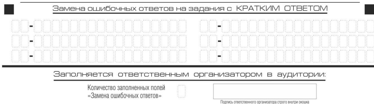
Рис. 9. Область замены ошибочных ответов на задания с кратким ответом

В нижней части одностороннего бланка ответов № 1 предусмотрены поля для записи исправленных ответов на задания с кратким ответом взамен ошибочно записанных (рис. 9).