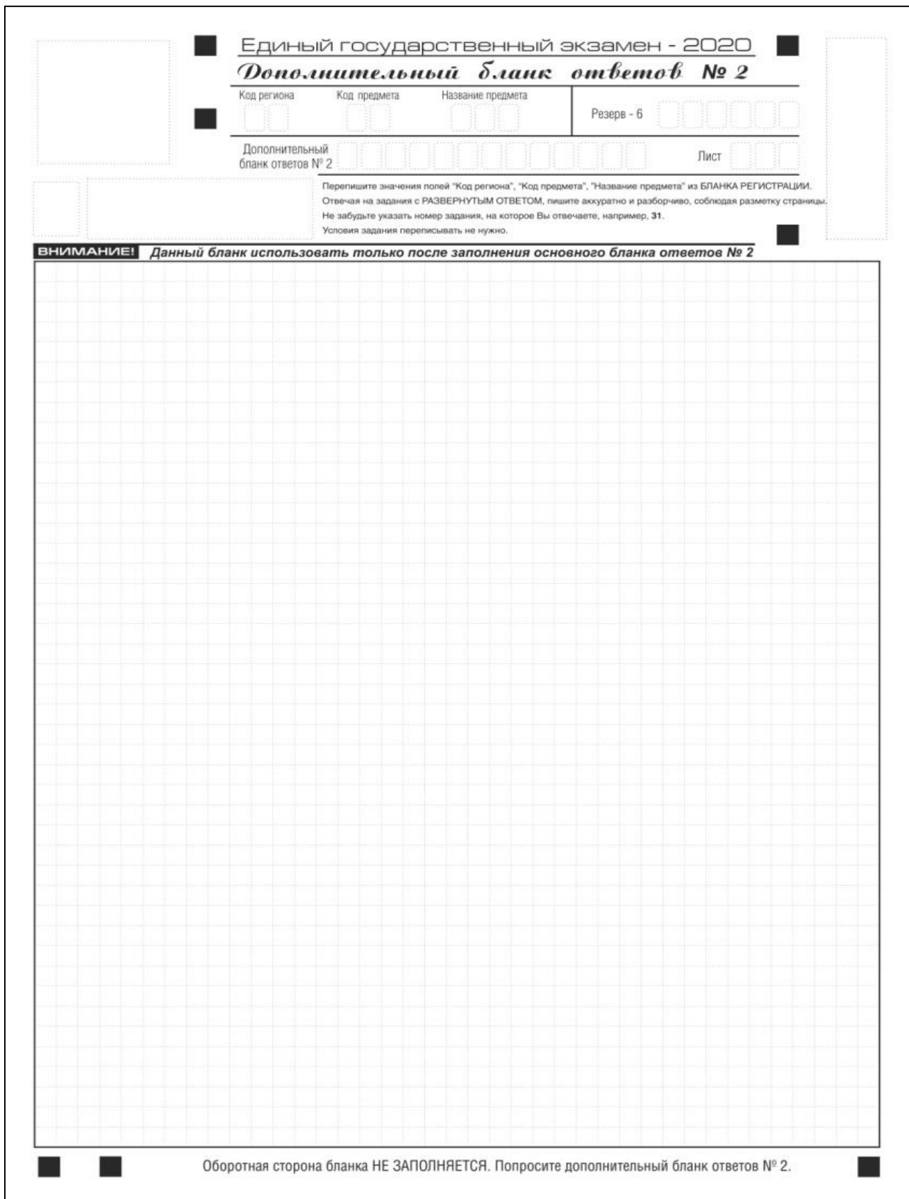
Рис. 15. Дополнительный бланк ответов № 2